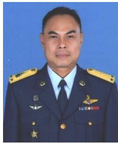
พล.อ.ต.น้อย ภาคเพิ่ม