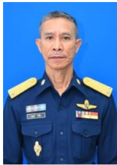
พล.อ.ต.เสน่ห์ บัวชื่น ผู้บัญชาการวิทยาลัยการทัพอากาศ