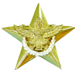
รูปภาพที่ ๒ เข็มมณฑลยศ.ทอ.