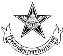
รูปภาพที่ ๑ สัญลักษณ์ของ วทอ.ยศ.ทอ.