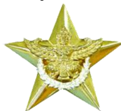
รูปภาพที่ ๒ เข็มมณฑลยศ.ทอ.